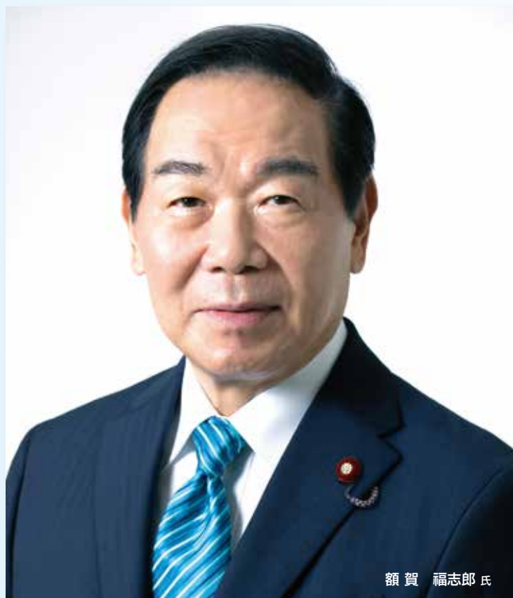
額賀 福志郎 氏

講演 自由民主党副幹事長 参議院議員 上月 良祐 氏 演題 「我が国のエネルギー政策と世界の情勢について」(仮題)